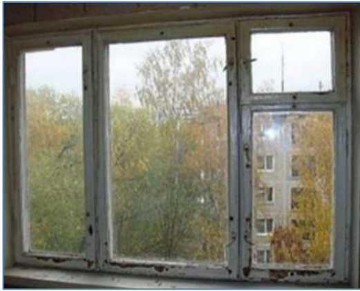
1. Дрвени, једноструки са једним стаклом